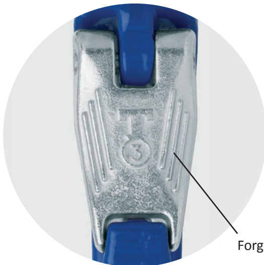
Forged Safety Latch